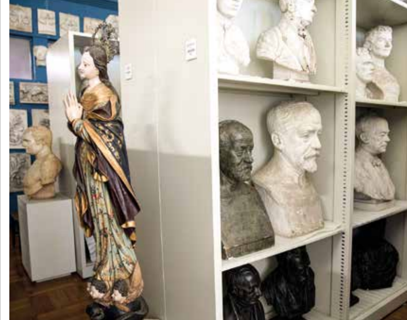
IMAGEM de Nossa Senhora já sobreviveu a dois incêndios na UFRJ

lado do atual, que receberia a EBA – hoje dispersa pelo Fundão – e seu Museu. A estimativa de investimento é de R$ 35 milhões, verba que a universidade não tem.