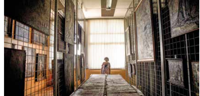
AS ESCURAS pinturas não podem ser apreciadas pelo público

andares atingidos pelo incêndio. Mas não deu previsão para o retorno do funcionamento normal do Museu. Além disso, informou que há projeto para a construção de um prédio, ao