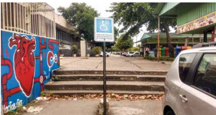
BARREIRAS As escadas representam um obstáculo para todos os cadeirantes que frequentam as dependências da universidade. No Palácio, não há uma rampa sequer