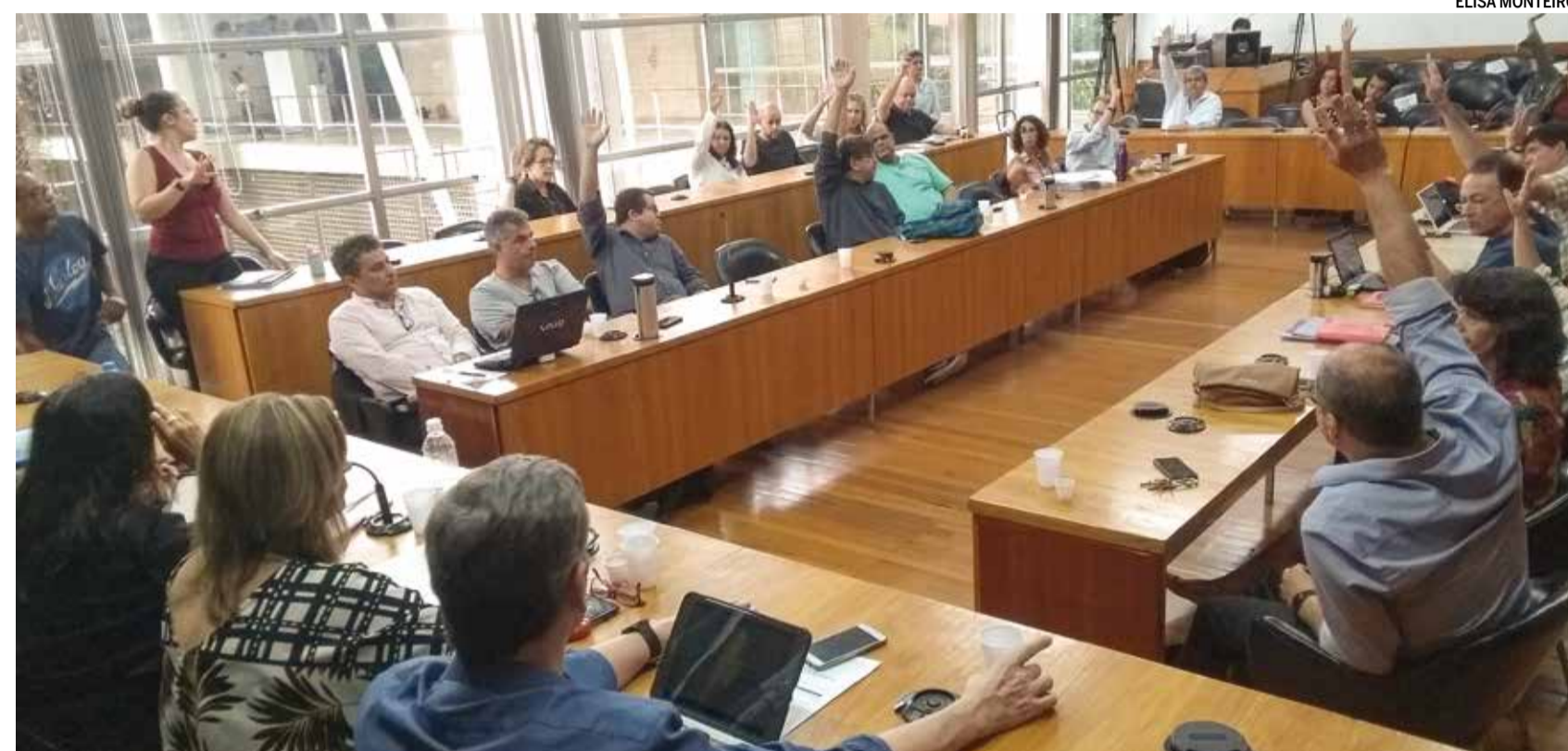
CEG E CEPG colegiados aprovaram a proposta da Comissão Temporária de Alocação de Vagas, em reunião conjunta realizada no dia 29

“Tivemos 31 vagas, mas recebemos duas. Não chegamos a 10% da demanda”, inter-