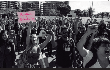
Estudantes defendem diversidade