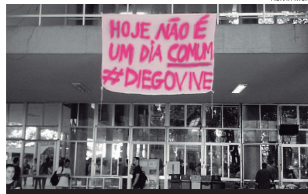
Comunidade unida pede paz