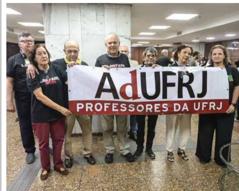
ADUFRJ PRESENTE Diretoria crítica lawfare e apoia colegas

“Estou otimista. Sigo cada vez mais convicto da boa-fé na administração desses recursos”