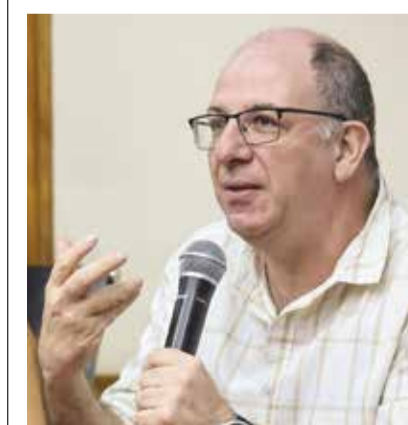
GHERMAN: “Tarefa histórica de produzir reflexão sobre o país”

combate não só à violência, mas principalmente ao discurso sobre a violência. As universidades do Rio de Janeiro estão construindo uma esperança, a de que o discurso acadêmico influencie efetivamente o discurso público”, afirmou.