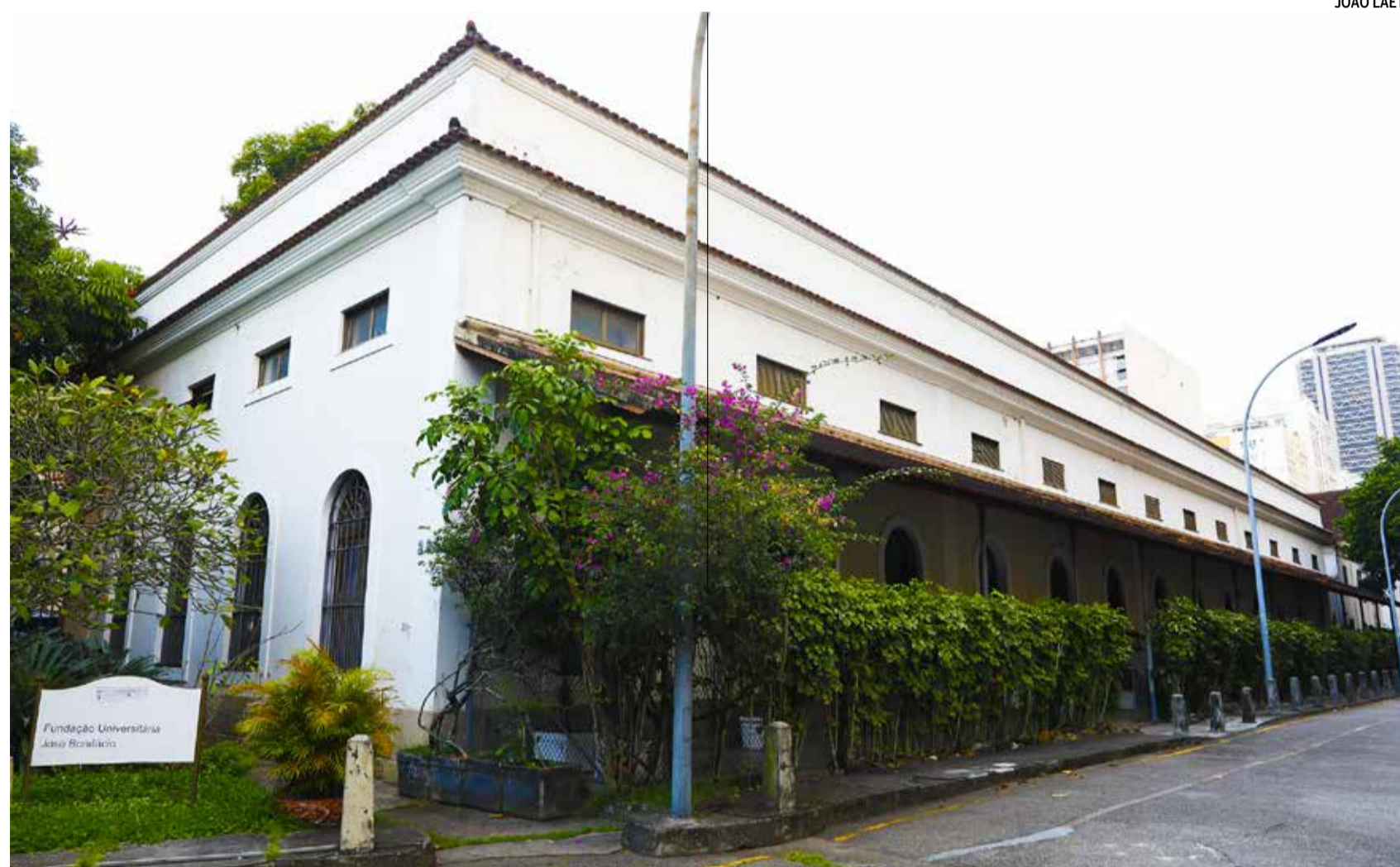
“NOVA FUJB” Entre as medidas adotadas pela diretoria está a criação de uma nova sede no Fundão. Acima, a atual sede da Praia Vermelha