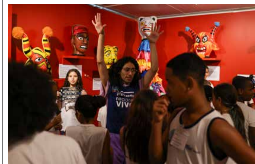
MONITORES orientam os estudantes e lideram atividades em grupo

licas da exposição “Um museu de descobertas” sejam aquelas resgatadas dos escombros do incêndio de 2018. Elas contam uma dolorosa e vigorosa história de dedicação e carinho ao Museu Nacional. Uma delas é uma réplica do amuleto de escarvalho da sacerdotisa egípcia Sha-Amun-em-su feita com as cinzas do Museu Nacional. O resgate do amuleto nos escombros, em 2019, permitiu uma digitalização em 3D e a confecção da réplica exposta. O amuleto original foi encontrado dentro do esquite da sacerdotisa, que foi sepultada em Tebas por volta de 750 a.C. O esquite foi recebido por D. Pedro II como presente do rei egípcio Quediva Ismail, em 1876.