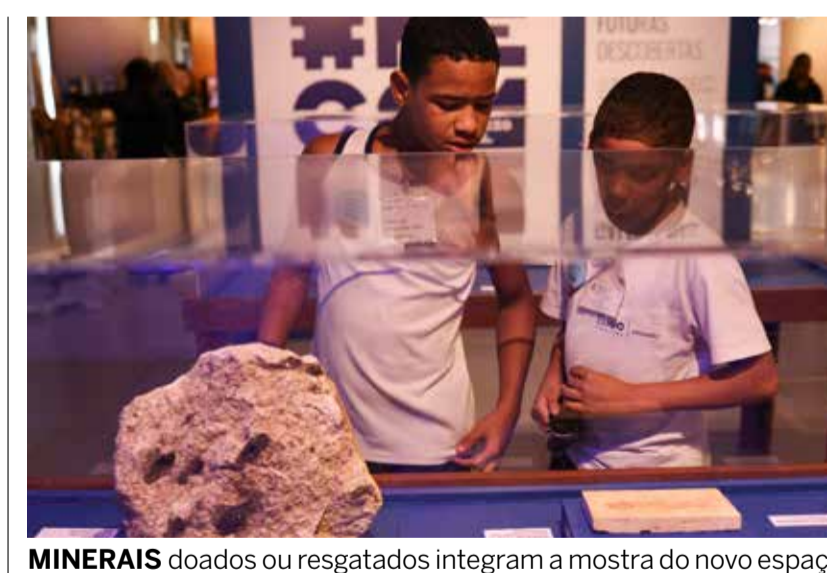
MINERAIS doados ou resgatados integram a mostra do novo espaço