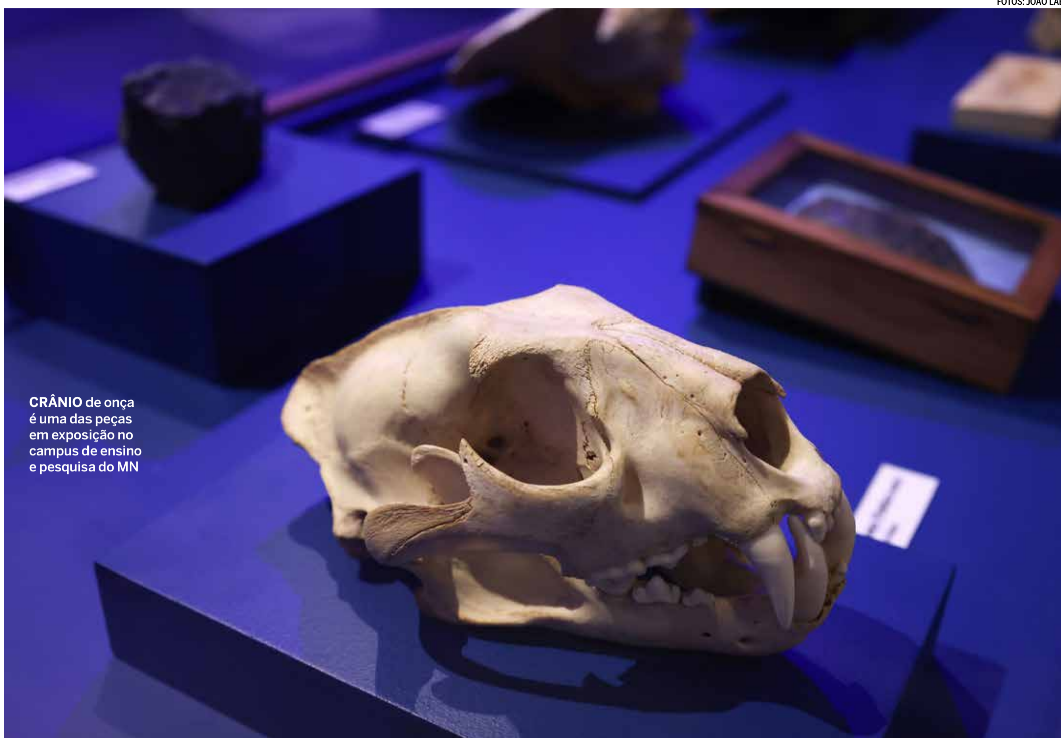
CRÂNIO de onça é uma das peças em exposição no campus de ensino e pesquisa do MN