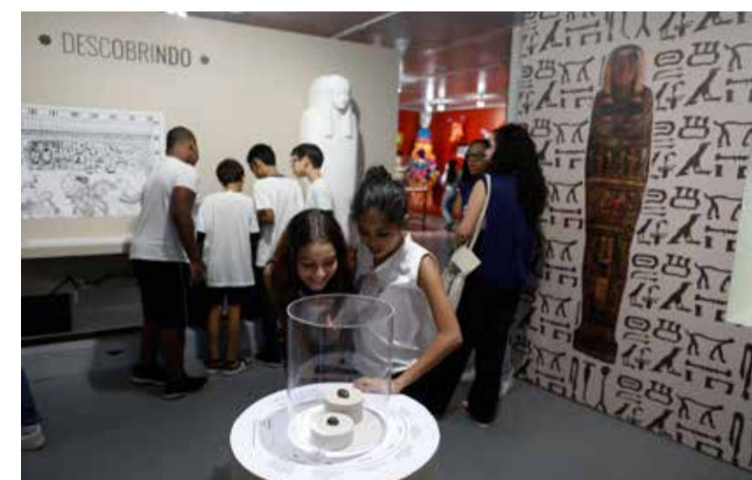
PEÇAS confeccionadas a partir de cinzas do incêndio são destaque

2021, três anos após o incêndio, e já angariou 10.000 peças. Esse novo acervo está sendo catalogado e vai compor quatro novos circuitos de visitação quando o Palácio de São Cristóvão for reaberto: Histórico, Universo e Vida, Diversidade Cultural e Ambientes do Brasil. Quem quiser contribuir pode se informar em (recompoe.mn.ufrj.br/acervo).