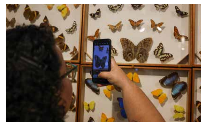
BORBOLETAS empalhadas em telas encantaram os estudantes