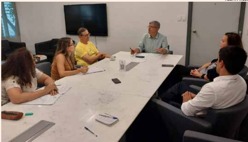
PROGRESSÕES. Diretoria da AdUFRJ quer agilizar resolução sobre progressões

Os diretores também reivindicaram à reitoria que a minuta de resolução ajude